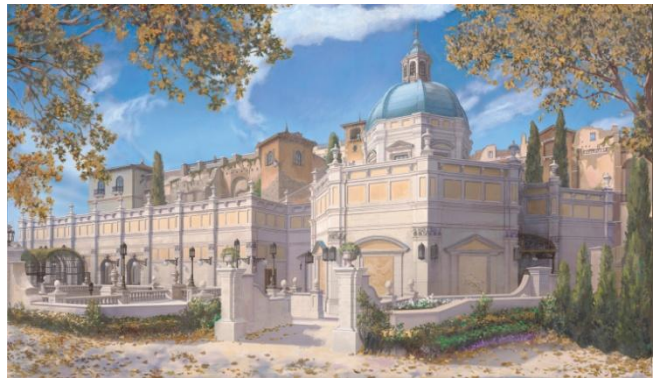
‘소링: 판타스틱 플라이트’ 외관

‘소링: 판타스틱 플라이트’는 해외의 디즈니 테마파크에서 높은 인기를 자랑하는 대형 어트랙션 ‘소링’에 새로운 장면을 추가한 도쿄디즈니씨 오리지널 어트랙션입니다.