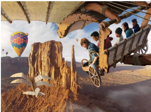
‘소링: 판타스틱 플라이트’ 체험 장면

도쿄디즈니씨의 메디테라니언 하버에 도입 예정인 신규 대형 어트랙션 ‘소링: 판타스틱 플라이트’의 오픈 날짜가 2019년 7월 23일(화)로 결정되었음을 알려드립니다.