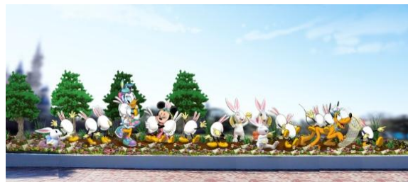
데코레이션 (신데렐라 성 앞 플라자)