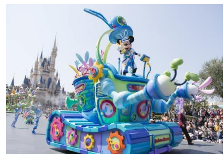
도쿄디즈니랜드 ‘디즈니 이스터’