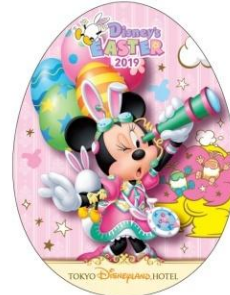
도쿄디즈니랜드 호텔 엽서