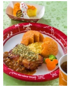
‘그랜마 사라의 키친’ 스페셜 세트 1,580엔