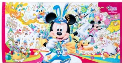
대형 목욕 수건 3,400엔