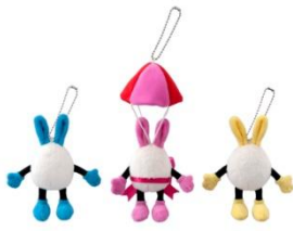
스트랩 세트 1,800엔

도쿄디즈니랜드에서는 퍼레이드 ‘우사타마 대탈주!’에 등장하는 ‘우사타마’나 ‘우사타마 체이서’로 변신한 디즈니 친구들이 그려진 상품과 ‘우사타마 체이서’로 변신할 수 있는 편캡 등의 상품이 약 60종류 등장합니다.