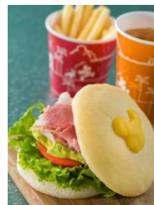
‘뉴욕 델리’ 스페셜 세트 1,230엔

‘뉴욕 델리’에서는 달걀프라이 모양의 빵에 햄과 아보카도를 넣은 샌드위치가 포함된 스페셜 세트가 등장하고, ‘카페 포르토피노’에서는 달걀을 사용한 인기 요리인 카르보나라와 달걀로 장식한 색색의 전채요리, 달걀을 깬 듯한 모양이 특