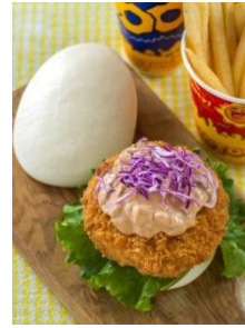
‘휴이·듀이·루이의 굿타임 카페’ 스페셜 세트 990엔

‘휴이·듀이·루이의 굿타임 카페’에서는 달걀 모양의 파오(찐빵)에 스크램블드에그와 햄카츠를 넣은 스페셜 메뉴를, ‘그랜마 사라의 키친’에서는 깨진 달걀 모양의 케첩 라이스와 스크램블드에그를 비롯하여 달걀 모양의 초콜릿을 사용한 디저트가 포함된 스페셜 세트를 준비합니다. 이 밖에도 ‘우사타마’가 그려진 기념컵 포함 디저트 등도 판매합니다.