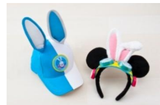
편캡 2,500엔 머리띠 1,800엔