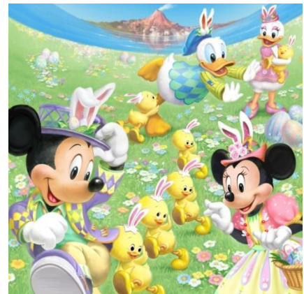
도쿄디즈니씨 ‘디즈니 이스터’

또한, 파크 곳곳에서는 달아난 ‘우사타마’들이 도쿄디즈니랜드를 즐기고 있는 모습이 담긴 데코레이션을 만나보실 수 있으며, 툰타운에서는 ‘우사타마’가 태어난 이스터 에그 공장 포토 로케이션도 등장합니다.