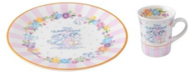
접시 1,300엔 머그잔 1,300엔