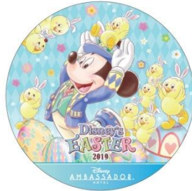
디즈니 앰버서더 호텔 엽서