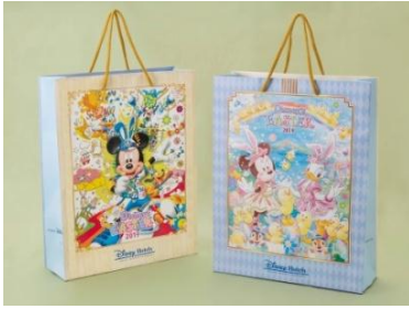
디즈니 앰버서더 호텔 도쿄디즈니랜드 호텔 종이가방(공통)

※레스토랑, 라운지의 ‘디즈니 이스터’ 메뉴는 3월 26(화)부터 선행 판매합니다.