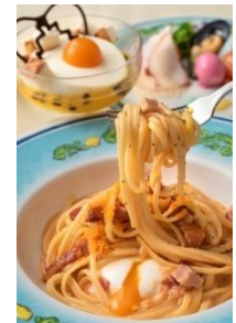
‘카페 포르토피노’ 스페셜 세트 1,880엔