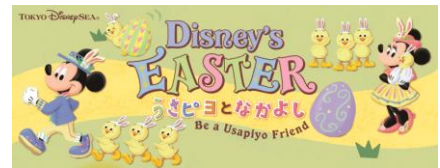
“‘디즈니 이스터’ 우사피요랑 친해지기” 표지

도쿄디즈니씨에서는 “‘디즈니 이스터’ 우사피요랑 친해지기”(무료)를 парк 안에서 배포합니다. 이를 통해 게스트 여러분은 ‘우사피요’와 더욱 친해질 수 있습니다. 함께 있으면 행복해지는 ‘우사피요’들과 ‘디즈니 이스터’를 즐겨보시는 것은 어떠신가요?