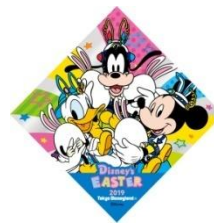
“‘디즈니 이스터’ 우사타마를 찾아라!” 오리지널 스티커