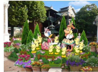
데코레이션 (아메리칸 워터프런트)