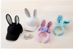
모자 각 2,600엔 우사미미 머리띠 각 1,300엔 머리끈 700엔~900엔

이 밖에도 토끼 캐릭터, 미스 바나나 덤퍼가 디자인된 새로운 생활의 시작을 장식해 줄 테이블웨어, 인테리어 상품 등이 약 30종류 등장합니다.