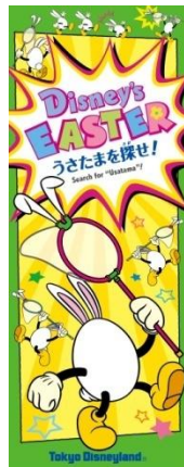
“‘디즈니 이스터’ 우사타마를 찾아라!” 표지

도쿄디즈니랜드에서는 파크 곳곳에서 놓고 있는 ‘우사타마’들을 찾아내는 “‘디즈니 이스터’ 우사타마를 찾아라!”(무료)를 파크 안에서 배포합니다. 지도에 적혀있는 ‘우사타마’ 목격 정보를 힌트로 하여 파크 안 이곳저곳으로 달아난 ‘우사타마’를 찾습니다. ‘우사타마’를 찾아낸 게스트에게는 프로그램 달성 기념으로 오리지널 스티커를 선물로 드립니다.