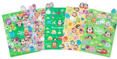
클리어 홀더 세트 1,100엔